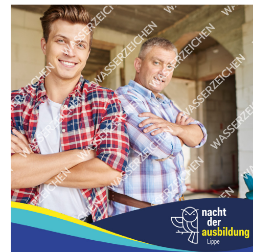
Keine oder unzureichende Bildnutzungsrechte