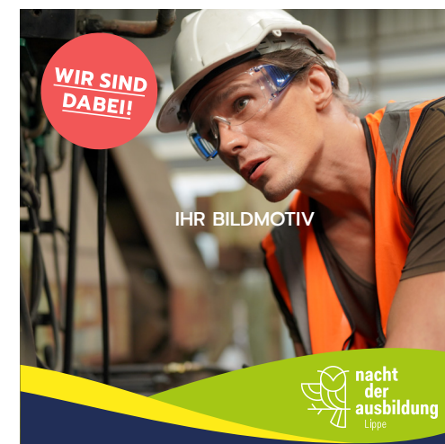
Änderung der Vorlagen-Farben