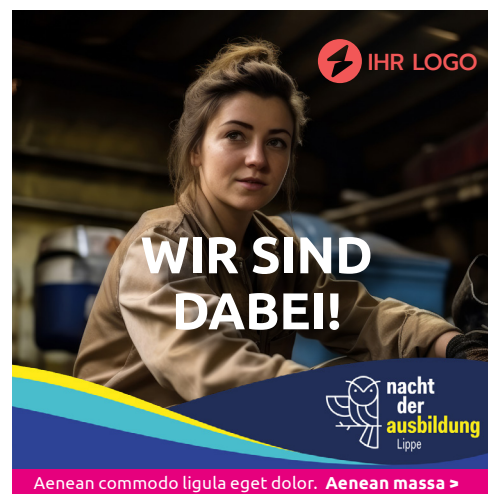
Abweichung vom Vorlagen-Layout